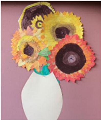
Zonnebloemen van Van Gogh

We hebben de afgelopen tijd ook echte kunstwerken gemaakt met handvaardigheid en tekenen. Hieronder een klein impressie.