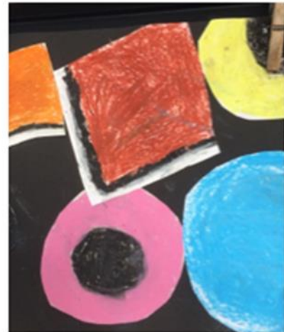
Engels drop vergroot natekenen (daarna lekker opeten).

Voor alle data geldt D.V. (Zo de Heere wil en wij leven zullen)